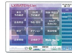
▲メインメニュー画面(受付側)

受付機・予約機・表示機(診療状況)との接続も可能、多数のレセコン・電子カルテとの接続実績もあります。