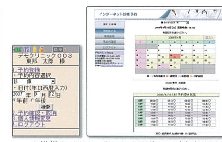
▲携帯とインターネットの予約画面(患者さん側)