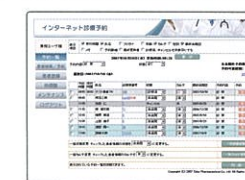
▲予約状況画面(受付側)

患者さんが、予約と同時に問診を入力することができるので、来院時の問診の手間も省け、事前に症状も確認できます。