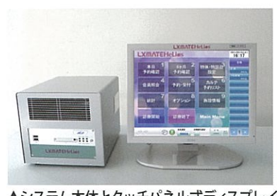
▲システム本体とタッチパネル式ディスプレイ