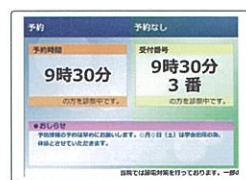
▲診察状況を案内する表示機

また、携帯・パソコンからのインターネット予約や、受付機・予約機・表示機(診療状況)との接続も可能です。多数のレセコン・電子カルテとの接続実績もあります。